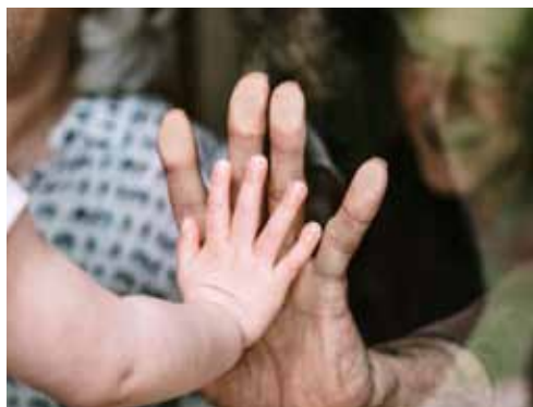
a cura della Commissione Famiglia cittadina